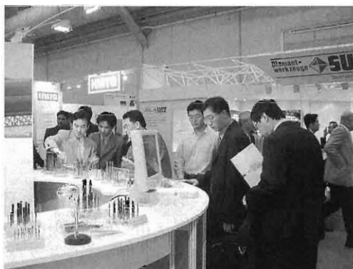
台湾からのお客様にタッチパネルを利用して商品 PR を行い、更に現物を説明する当社社員。