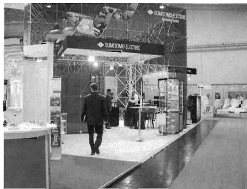
住友電気工業（株）ブース