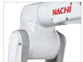
挟まれリスクを低減するオフセット形状