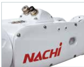
I/O 20芯・LAN 8芯1系統