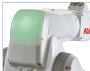
協働モード表示ランプ