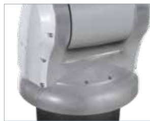
挟まれリスクを低減するストップカバー